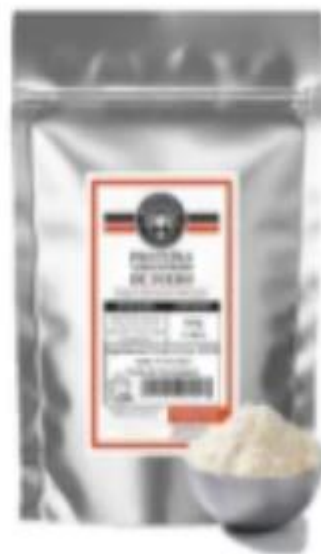
Proteína De Suero X500g Whey